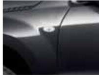
Quasar Grey Metallic (ZMA)