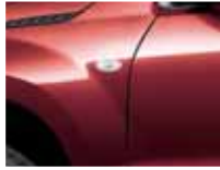
Phoenix Red Pearl (ZLB)