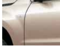
Clear Beige Metallic (ZDK)