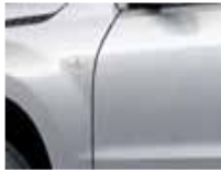
Silky Silver Metallic (Z2S)