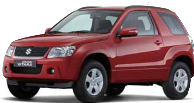
Grand Vitara, 3-türig