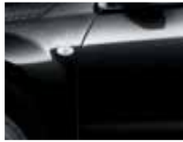
Bluish Black Pearl (ZJ3)