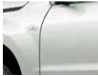
Pearl White (Z7T)