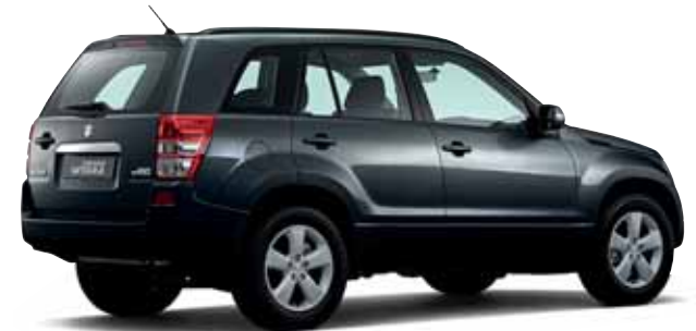
Grand Vitara, 5-türig