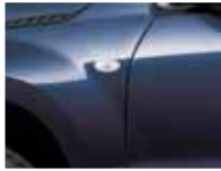
Nocturne Blue Pearl (ZJP)