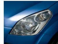
Kashmir Blue Pearl (ZCG)