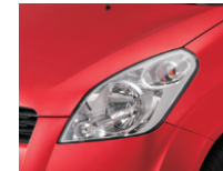
Bright Red (ZCF)