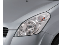
Galactic Gray Metallic (ZCD)