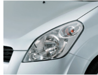
Silky Silver Metallic (ZCC)