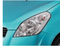
Splash Turquoise Blue Metallic (ZKC)