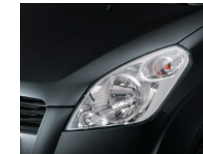
Cosmic Black Metallic (ZCE)