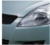
Smoky Green Metallic 2 (ZRL)