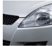
Star Silver Metallic (ZMU)