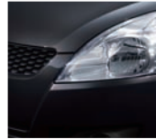
Super Black Pearl (ZMV)