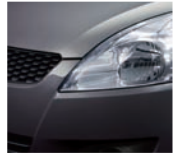
Mineral Gray Metallic (ZMW)