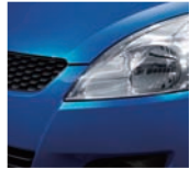
Boost Blue Pearl Metallic (ZRX)