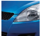
Kashmir Blue Pearl Metallic 2 (ZCG)