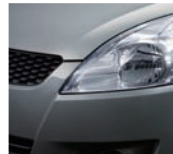
Galactic Gray Metallic (ZCD)