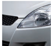
Silky Silver Metallic 2 (ZCC)