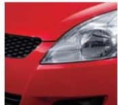
Bright Red 5 (ZCF)