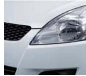
Snow White Pearl (ZMT)