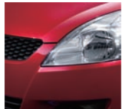
Ablaze Red Pearl (ZRK)