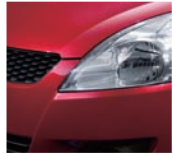
Ablaze Red Pearl 2 (ZRJ)