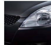
Cosmic Black Pearl Metallic (ZCE)