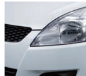
Cool White Pearl (ZNL)